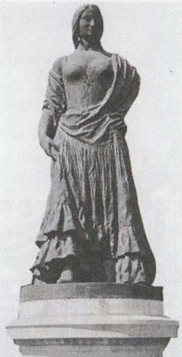
Afbeelding van Carmen

La Carmencita zingt tijdens een werkpaauze van de sigarettenfabriek, gesteund door de andere vrouwen uit de fabriek, een ballade en probeert daarmee de aandacht te trekken van Don José. Carmen raakt bij een vechtpartij betrokken, wordt opgepakt en aan dezelfde Don José overgedragen. Zij heeft haar doel bereikt, de aandacht die ze eerst niet kreeg heeft ze nu wel. Middels het bekende liefdeslied weet ze haar vrijlating te bewerkstelligen.